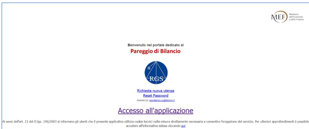
Figura 1: pagina iniziale

È necessario compilare il modulo di richiesta (figura 2).